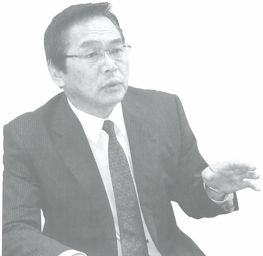
Top Interview 巻頭インタビュー

るお陰で、私達の目標である「より良い食材を提供し、子どもたちの豊かな心と体を創る」という共通の思いを実現することが出来ているのだと思います。本当にいつも感謝の気持ちでいっぱいです。