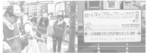
※写真は弊社グループ会社での活動風景です

またクリーン活動以外でも社会に貢献出来る事を常に考えていき、CSR活動については今後も活発的に活動をしていき、企業としての責任を全うしていきたいと考えております。